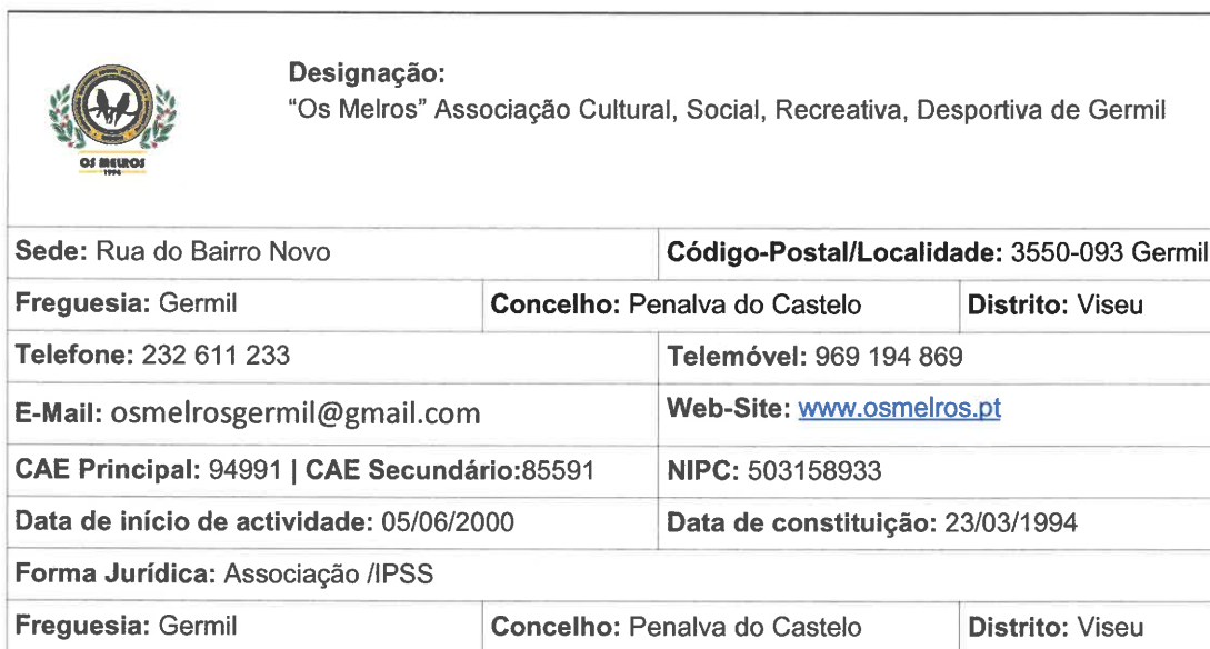
Figura 1- Identificação de “Os Melros”

Os dados gerais de identificação da Associação estão descritos na figura 1.